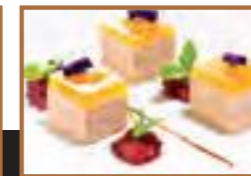
Foie gras aux agrumes