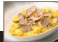
Pâtes à la truffe blanche d'Alba