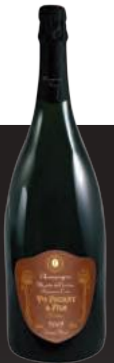
(Grands flacons en quantité très limitée)

Pour apporter une précision sur l'origine de nos lieux-dits, notre cuvée s'appelle Monts de Vertus. Elle est composée uniquement de Chardonnay, provenant de nos parcelles de vignes âgées de plus de 60 ans, situées en milieu de coteau sur une craie affleurante, qui engendre des vins de grande garde, avec leur style très pur, minéral et salin.