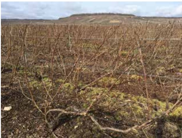
Nos vignes avant la taille