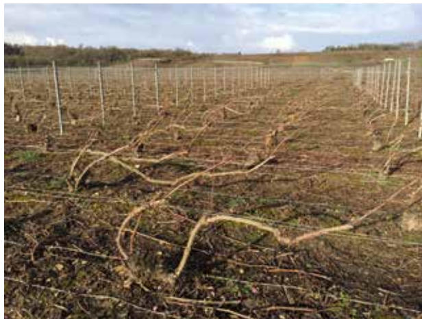
Nos vignes taillées et liées