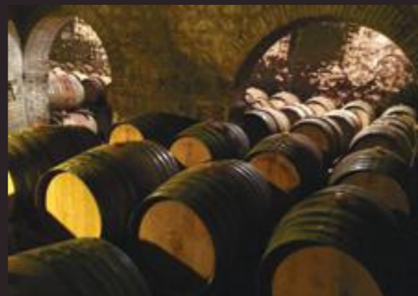
Notre chai à barriques au coeur de notre cave en pierre apparente.