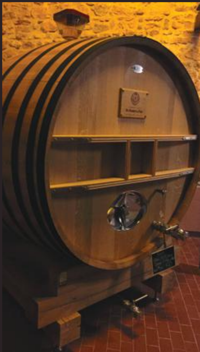
Nos nouveaux foudres ont trouvé leur place dans notre nouvelle cuverie.

Nous souhaitons ouvrir une nouvelle voie, bien plus rare en Champagne, l'utilisation d'un contenant différent : le foudre. En bois de chêne naturellement, il est d'une contenance plus importante, ce qui va offrir un échange bien différent entre le vin et le bois. Le foudre va lentement apporter une « patine » à nos vins de réserve, l'essence même du style Veuve Fourny, que nous retrouvons dans nos cuvées les plus emblématiques.