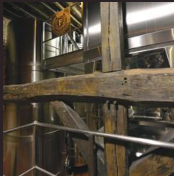
Nos petites cuves inox s'intègrent parfaitement à l'architecture historique de la Maison.